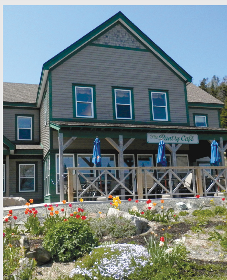
Le Pantry Café offre une bouffée de nature à Saint-Jean.

Le site http://autismcanada.org/fr/ propose des grilles de dépistage. Notez cependant que ces grilles ne sont pas des outils diagnostique.